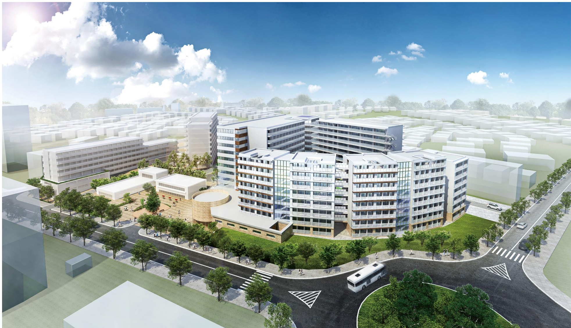
完成予想イメージ